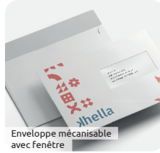
Enveloppe mécanisable avec fenêtre