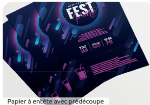
Papier à en tête avec prédécoupe