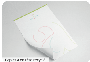
Papier à en tête recyclé