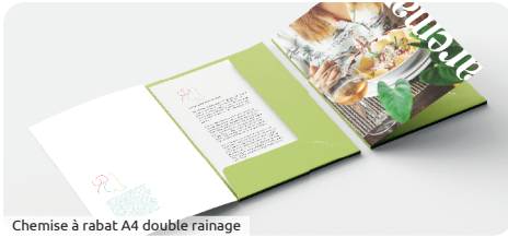
Chemise à rabat A4 double rainage