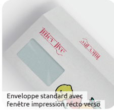
Enveloppe standard avec fenêtre impression recto verso