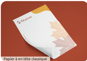
Papier à en tête classique